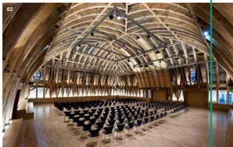
02 Kuppelsaal Technische Universität, Wien | Generalsanierung des Mittelrisalits mit Ausbau des Dachbodens im Nebentrakt und Umbau des Kuppelsaals