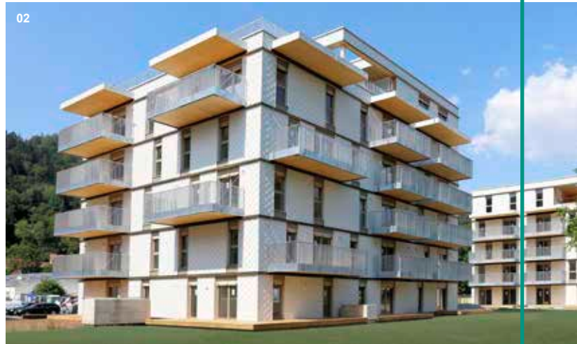
02 Wohnhausanlage Rechte Mürzzeile, Kapfenberg | Vier Baukörper zu je vier bzw. fünf Geschoßen mit insgesamt 68 Wohneinheiten