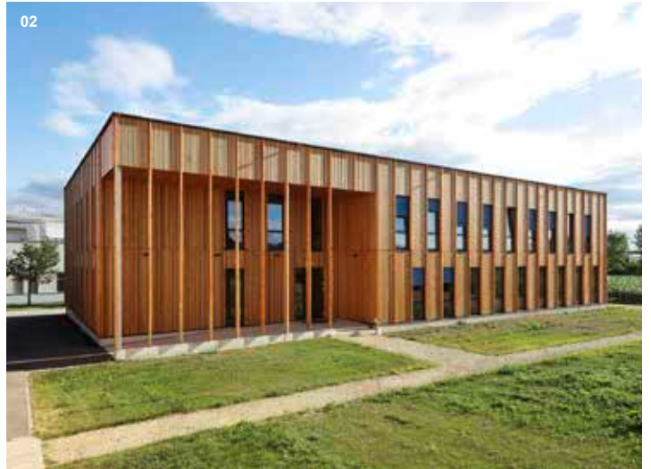
02 Interuniversitäres Department für Agrarbiotechnologie (IFA) BOKU, Tulln | Zweistöckiger Neubau in Holz-Leichtbauweise (Ausgezeichnet mit dem NÖ Holzbaupreis 2018)