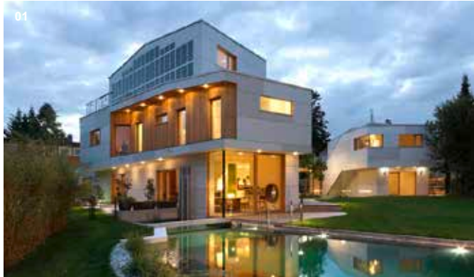
01 Einfamilienhaus, Wien | Zweigeschoßiger Neubau als Teil-Generalunternehmer

EINFAMILIENHÄUSER | MEHRFAMILIENHÄUSER | WOHNHAUSANLAGEN