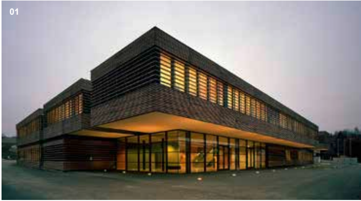
01 Höhere Technische Lehranstalt, Mistelbach | Zweigeschoßiger Holzelementbau in Passivhaus-Standard (Ausgezeichnet mit dem NÖ Holzbaupreis 2007)

KINDERGÄRTEN | SCHULEN | HOCHSCHULEN | FORSCHUNGSGEBÄUDE | SAKRALE BAUTEN | TOURISTISCHE EINRICHTUNGEN