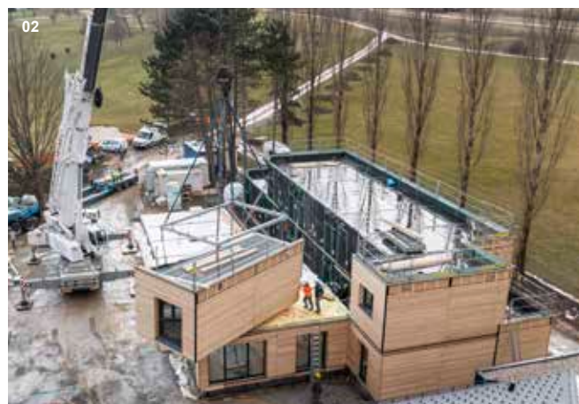
01 Kabanen Kuchelauer Hafen, Wien | Errichtung von 17 Edelbadehäusern in Modulbauweise